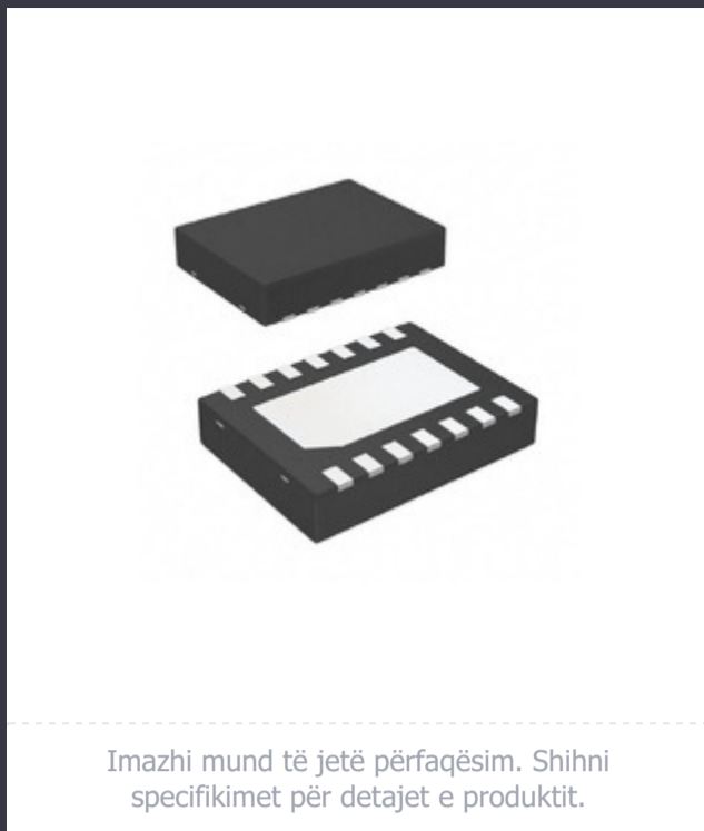
Imazhi mund të jetë përfaqësim. Shihni specifikimet për detajet e produktit.